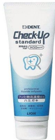
チェックアップ (6歳以上が対象です)