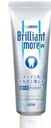
ブリリアントモア