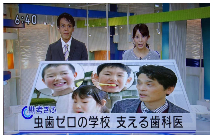
NHKで放送された一場面