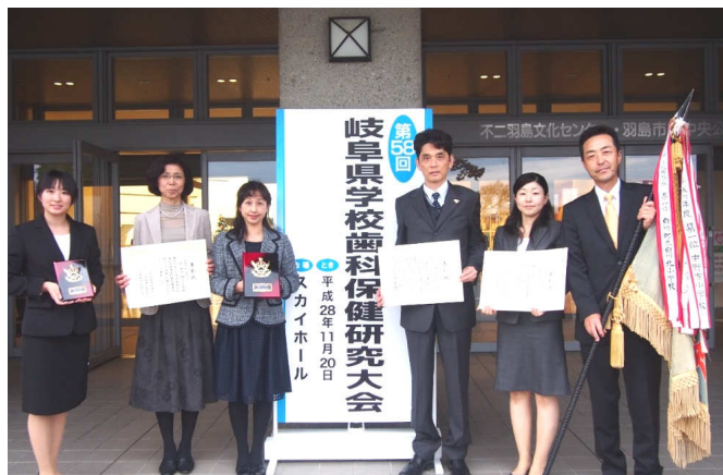
岐阜県学校歯科保健研究大会にて白川北小、 白川小学校関係者との記念写真