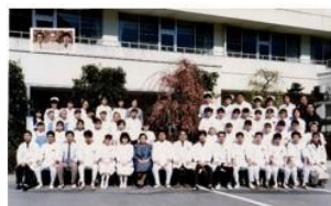
MRI 導入 H2