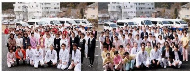
創立 70 周年 H28 現在