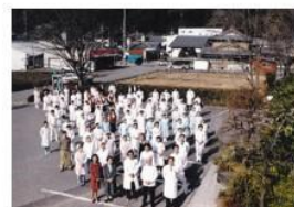
創立 50 周年 H8