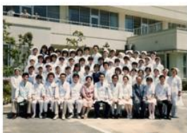
創立 40 周年 S61