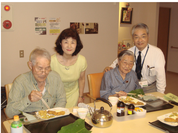
3周年記念の会食会