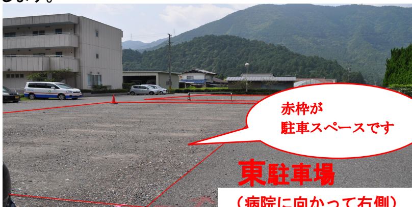
東駐車場 (病院に向かって右側)

病院正面右側に患者様用駐車スペースを設置しました。場所はピンクリボンの目印をしてあります。外来患者様には空いているところに自由に止めていただけます。大変ご迷惑をおかけいたしました但よろしくお願ひ致します。