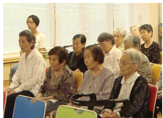
尺八に聴きほれる健遊館の皆さん

手作りのアクリルパイプの尺八を使った歌 謡曲や童謡の演奏に入居者の方々も一緒に 口ずさんでいました。